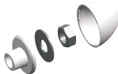
BUAK per sanitari sospesi