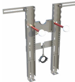
Configurazione PREMIUM per bidet