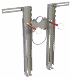
Configurazione PREMIUM per WC